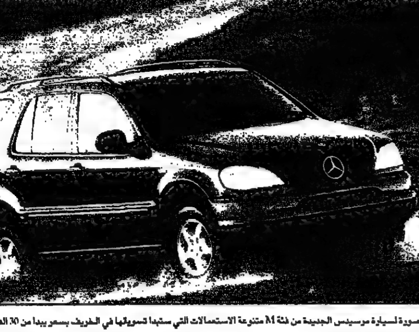
اول سيارة مرسيدس الميمنه من فئة N1 متوفرة في السوق العراقية، مصنوعة في ألمانيا.

للمجموعة - رويترز - قالت المؤسسة العربية المصرفية احدي اكبر البنوك في العالم العربي ان ارباحها انما هي ارباحا 129 مليون دولار في عام 1996. وقال مدير المؤسسة العربية المصرفية: "إننا نرى تحقيقا للمعادن من خلال الامم المتحدة". وقال مدير المؤسسة العربية المصرفية: "إننا نرى تحقيقا للمعادن من خلال الامم المتحدة".